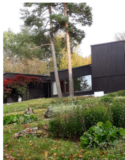
Villa Kokkonen sijaitsee upealla paikalla