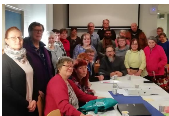
Etelä-Hämeen kokous helmikuussa 2020

Yhdistys järjesti kaksi tuettua lomajaksoa Hyvinvointilomat ry:n kanssa.