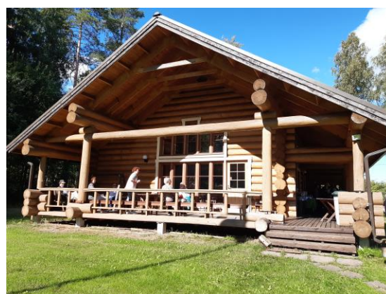
Vimpasaaren Paperiliiton huvila

Kumppanuustalo Hilman henkilökunnalta, olemme saaneet paljon apua ja neuvoja, tänä haasteellisena aikana. Kiitos jäsenille ymmärryksestä. Odotamme, että jatkossa pääsemme toimimaan suunnitelmien mukaan. Pidetään yhteyttä ja toisistamme huolta.